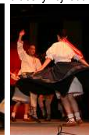
Volná zábava v MKD